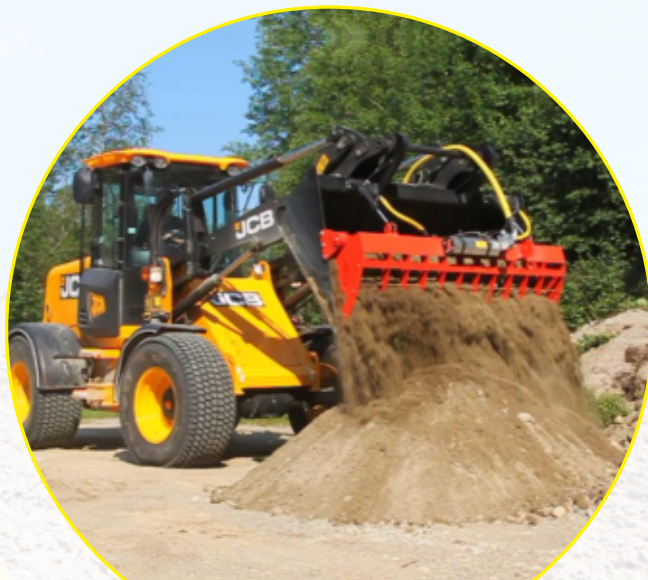
Sortering av sand.

1/2", 2-stålinlägg för vibrator, 1/4" 2-stålinlägg för cylindrar. Standardlängd när snabbkopplingar är placerade fram på redskapsfästet